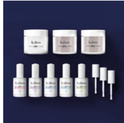
ZESTAW DO MANICURE TYTANOWEGO MAGIC DIP SYSTEM - MAGIC SANDY SET