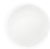
1 PURE CRYSTAL