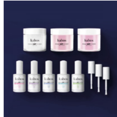
ZESTAW DO MANICURE TYTANOWEGO MAGIC DIP SYSTEM - MAGIC LOVELY SET