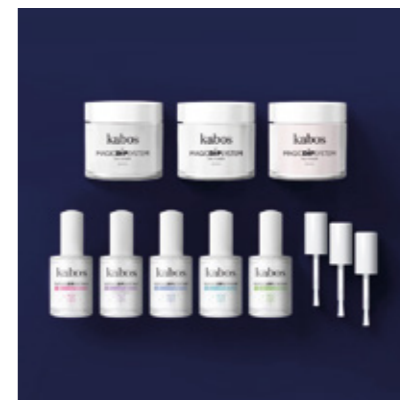
ZESTAW DO MANICURE TYTANOWEGO MAGIC DIP SYSTEM - MAGIC FRENCH SET