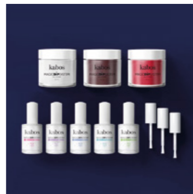
ZESTAW DO MANICURE TYTANOWEGO MAGIC DIP SYSTEM - MAGIC RED SET