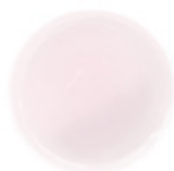
3 POWDER PINK