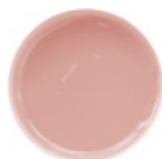
9 SMOKY PINK