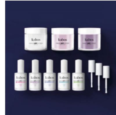
ZESTAW DO MANICURE TYTANOWEGO MAGIC DIP SYSTEM - MAGIC LILY SET