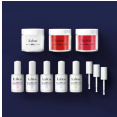
ZESTAW DO MANICURE TYTANOWEGO MAGIC DIP SYSTEM - MAGIC KISS SET