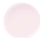
5 MILKY ROSE