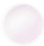
2 FRENCH PINK