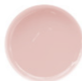
8 DUSTY ROSE