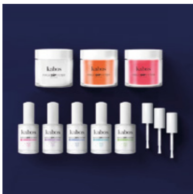
ZESTAW DO MANICURE TYTANOWEGO MAGIC DIP SYSTEM - MAGIC NEON SET