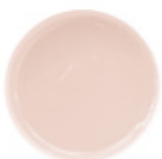
6 COVER LIGHT