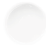
4 ABSOLUTE WHITE