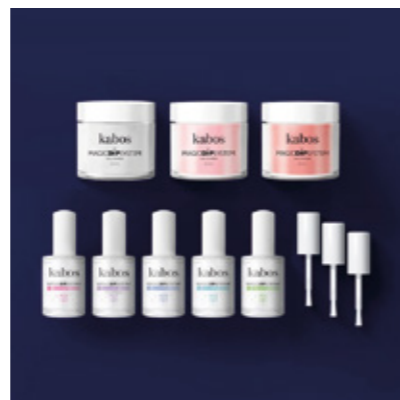
ZESTAW DO MANICURE TYTANOWEGO MAGIC DIP SYSTEM - MAGIC ROSE SET